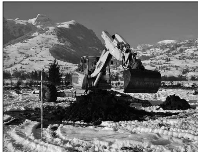
Baggerarbeiten beim neu geschaffenen Amphibienweiher auf einer ehemaligen Christbaumkultur beim Lobergraben.

Wie die starke Wanderung am Kiessammler zeigt, lebt im Talraum eine individuenstarke Grasfroschpopulation. Daraus erwächst für die Gemeinde eine Verantwortung für deren Erhaltung. Aus dem Talraum von Grabs, einer ehemaligen Riedebene, sind heute die Wasserflächen und damit Laichgebiete für Amphibien weitgehend verschwunden. Die Natur- und Umweltschutzkommission (NUK) setzt sich gemeinsam mit der Gemeinde daher seit mehreren Jahren für die Schaffung von neuen Wasserbiotopen ein. Ziel ist es auch, Alternativen für die immer schwieriger werdende Wanderung durch das Grabser Siedlungsgebiet zu bieten.