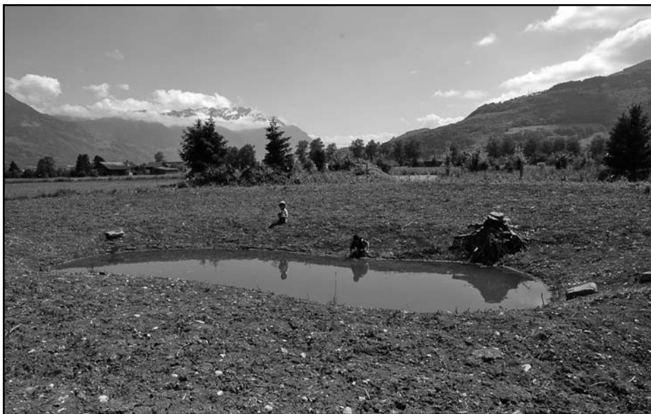
An der neu aufgewerteten Parzelle beim Lobergraben wurden auch eine Blumenwiese eingesät und Gehölze gepflanzt.

Bisher konnten auf einer Fläche der Ortsgemeinde im Püls, sowie beim Studnerbach und Anfangs 2009 beim Lobergraben neue Gewässer ausgehoben werden. Beim Lobergraben wurden auch Gehölze gepflanzt und eine Magerwiese angesät. Im Rahmen eines Umwelteinsatzes beteiligten sich im Mai mehrere Einwohnerinnen und Einwohner von Grabs an den dort notwendigen Unterhaltsarbeiten.