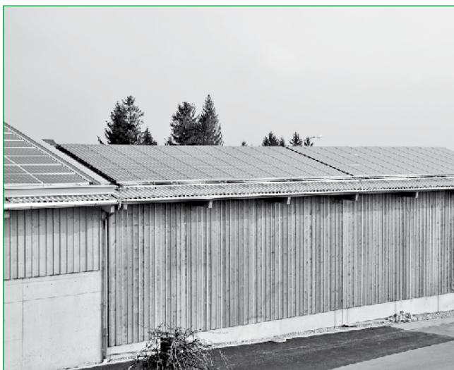
PV-Anlage auf dem Dach der Wertstoffsammelstelle