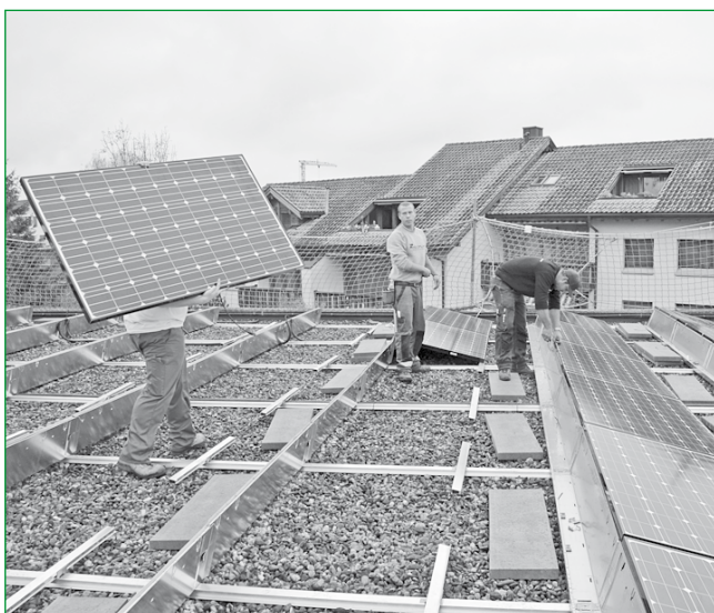
Verlegung der Solar-Panels auf dem EW-Gebäude