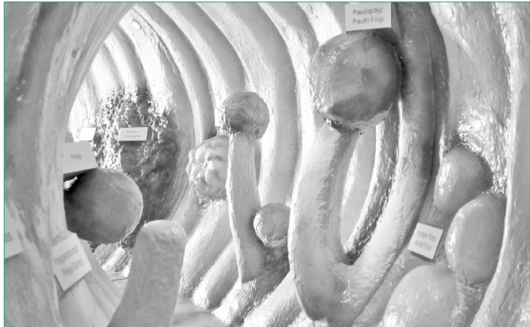
Das begehbare acht Meter lange Darmmodell bietet eine einzigartige Möglichkeit, sich über Darmkrebs sowie deren Früherkennung zu informieren.

In der Sonderschau zeigt ein Krebspräventions-Parcours, wie Mann und Frau dem Brust-, Prostata- und Darmkrebs vorbeugen können. Doch auch in unserer aufgeklärten und aufge-