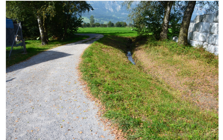
Durch den Lagewechsel von Lobergraben und Fahrweg kann eine Rohr-Unterquerung aufgehoben sowie der Durchlass in den Grabserbach neu fischdurchgängig gestaltet werden.

Damit wird die optimale Anbindung des Lobergrabens an den Grabserbach erreicht.