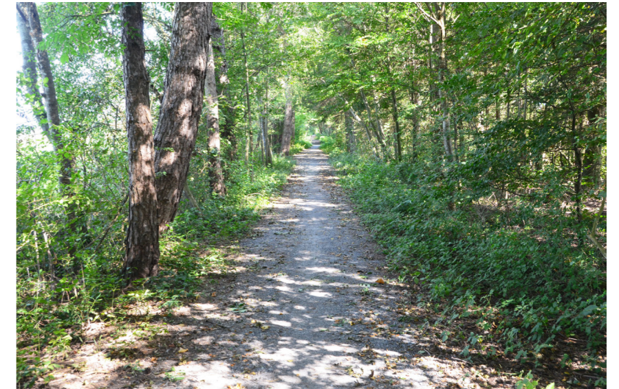
Der Vordere Grabserbachweg wird entlang der Revitalisierung teilweise umgelegt und zukünftig nicht mehr wie heute schnurgerade verlaufen, sondern sanfte Schlaufen aufweisen.

Der Vordere Grabserbachweg bleibt als Wanderweg erhalten und wird teilweise an das Gewässerufer geführt. Damit wird der Bach für die Erholungssuchenden erlebbar.