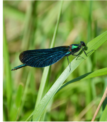
Blaufügelige Prachlibelle am Grabserbach.